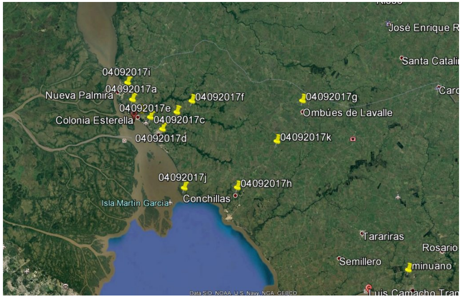
Localización de registros 4/9/2017-23:05UTC